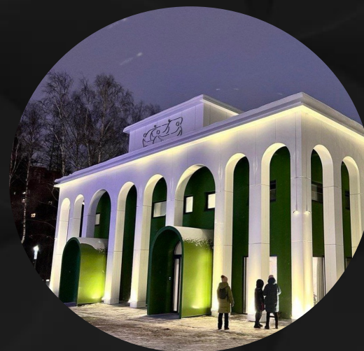
Дом народного единства